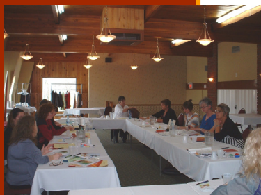
Les membres présentes lors de la rencontre du 2 mai dernier.

Vous pouvez retrouver nos documents sur la situation de l'emploi des femmes, soit la fiche synthèse et le document de référence sur notre site Web.